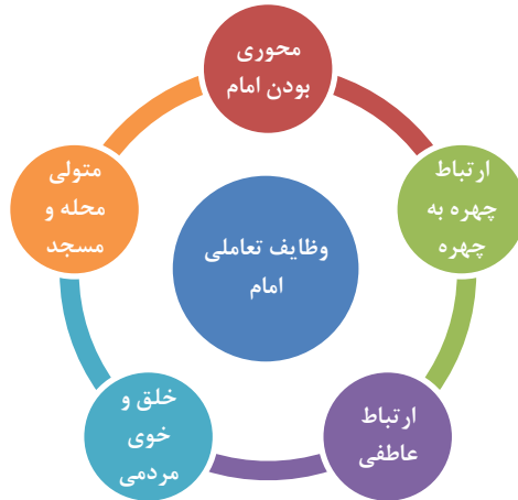
نمودار ۲- وظایف تعاملی امام جماعت