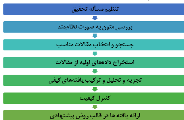
شکل ۳. فرآیند هفت مرحله‌ای فراترکیب

در این مقاله به منظور شناسایی ابعاد و مؤلفه‌های فرهنگ دانشگاهی و ارائه مدل، از روش کیفی فراترکیب استفاده شده است. بدین منظور محقق با استفاده از روش فراترکیب به استخراج مقولات و مفاهیم مربوط به فرهنگ دانشگاهی از طریق مرور نظام‌مند ادبیات موجود پرداخته و مدل پیشنهادی خود را ارائه می‌دهد. روش فراترکیب از انواع مختلف راهبردهای تحقیق کیفی است. این روش رویکردی نظام‌مند برای محققان فراهم می‌کند تا تحقیقات را ترکیب کرده و تم‌ها و استعاره‌های پنهان را شناسایی کنند و از این طریق دانش موجود را توسعه و دیدی جامع و گسترده‌ای ایجاد کنند (سایو و لانگ، ۲۰۰۵، ۱). از شناخته‌شده‌ترین الگوهای پیاده‌سازی روش فراترکیب که بیشترین استفاده را دارد، الگوی هفت مرحله‌ای ساندلوسکی و باروسو ۱ (۲۰۰۷) است. در پژوهش حاضر نیز این الگو به کار گرفته شده که مراحل انجام روش فراترکیب در این الگو به شرح زیر است: